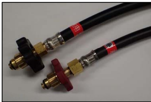
(ハンドル締めタイプ)

POL ニップルに防止弁が内蔵された液相用高圧ホース。容器から POL ニップルを外すと POL 内蔵の弁が閉じ、高圧ホース内の LP ガスの流出を防止する。