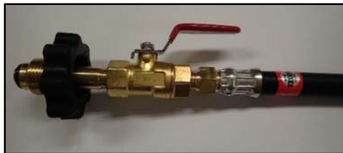
(ハンドル締めタイプ)

POL ニップルの先にバルブが付属している液相用高圧ホース。容器交換時にバルブを「閉」にすることで高圧ホース内の LP ガスの流出を防止できる。