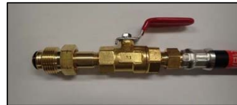
(スパナ締めタイプ)

※2021年6月現在、上記以外の液相用高圧ホースは製造されていません。なお、液流出防止型液相用高圧ホース以外の液相用高圧ホースには「液流出注意」の表示を行います。